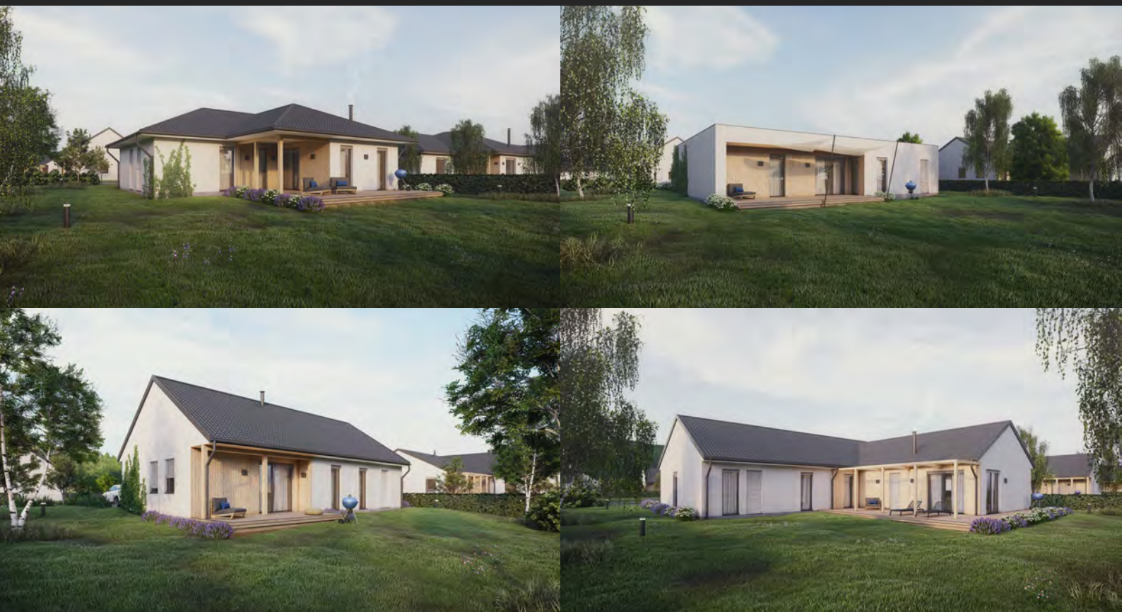
Studie nových typových domů, 24 typů, ČR Design of new houses, 24 types, CZ