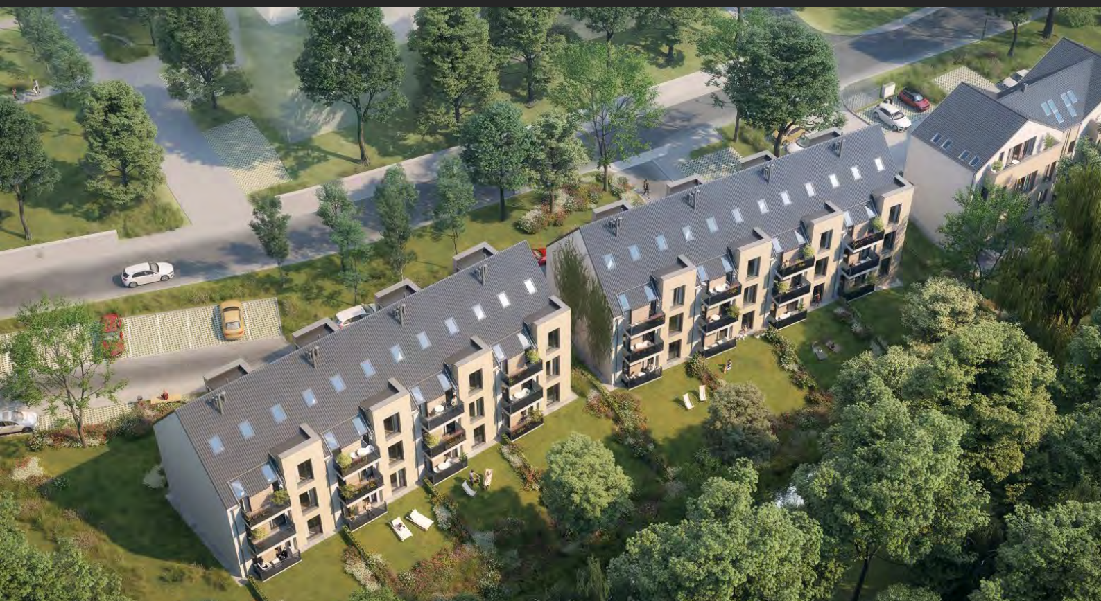
24 bytů v řadových rodinných domech, Středočeský kraj, ČR 24 apartments in terraced houses, Central Bohemian region, CZ