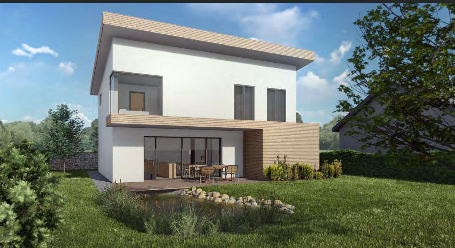
Přestavba rodinného domu, Středočeský kraj, ČR Reconstruction of a house, Central Bohemian region, CZ