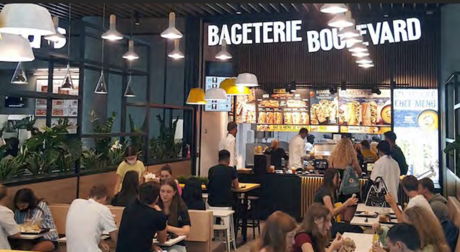
Obchodní prostory pro Vodafone a Bageterii Boulevard, ČR Retail units for Vodafone, Bageteria Boulevard and Pizza 360