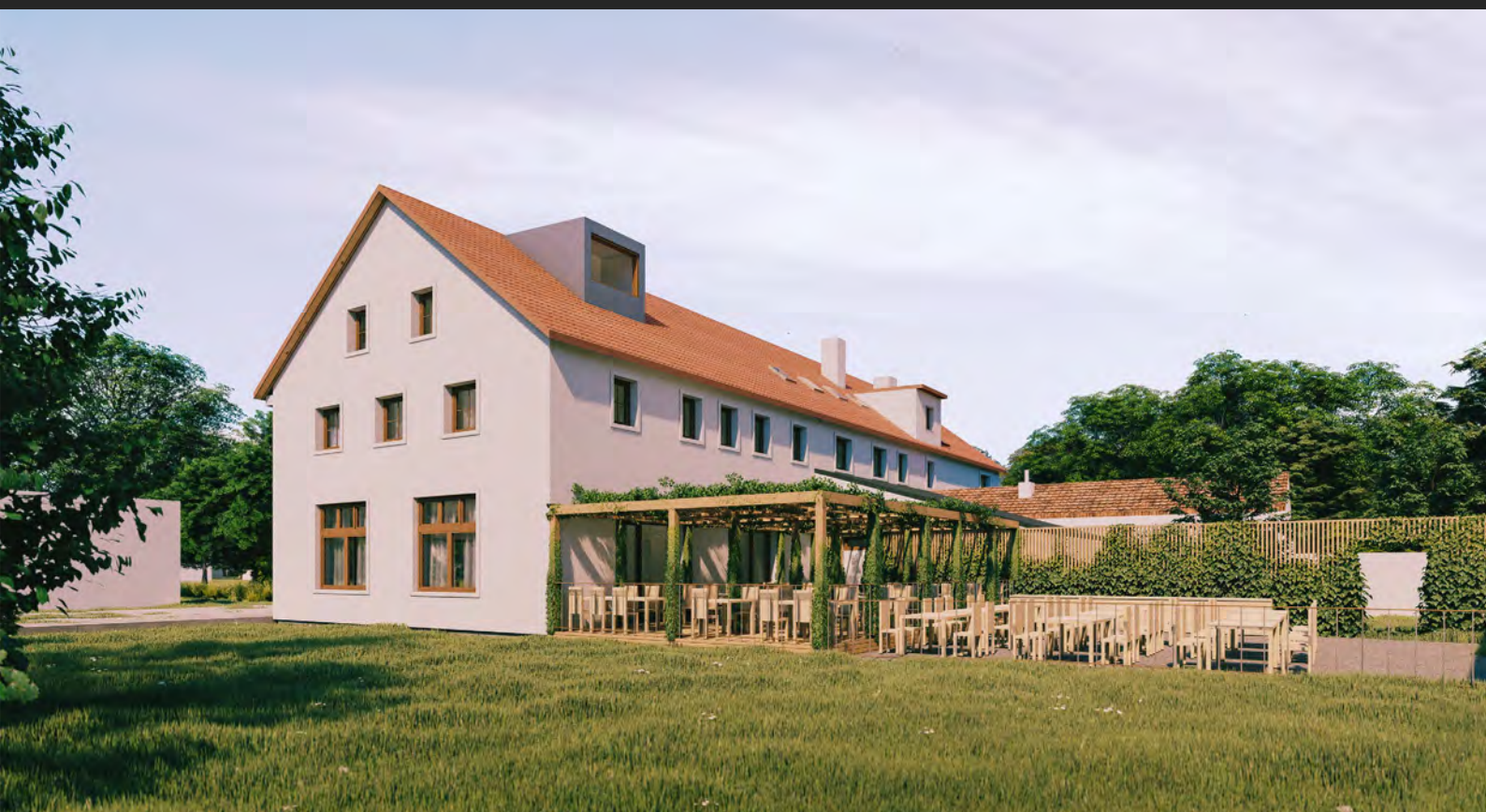
Hostinec s ubytováním, Jihočeský kraj, ČR Inn with accomodation, South Bohemian region, CZ