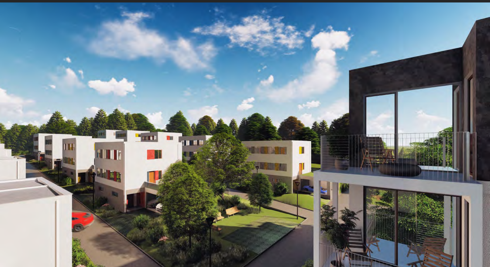
28 Rodinných dvojdomů a bytový dům, Královéhradecký kraj, ČR 28 semi-detached houses and apartment house, Hradec králové region, CZ