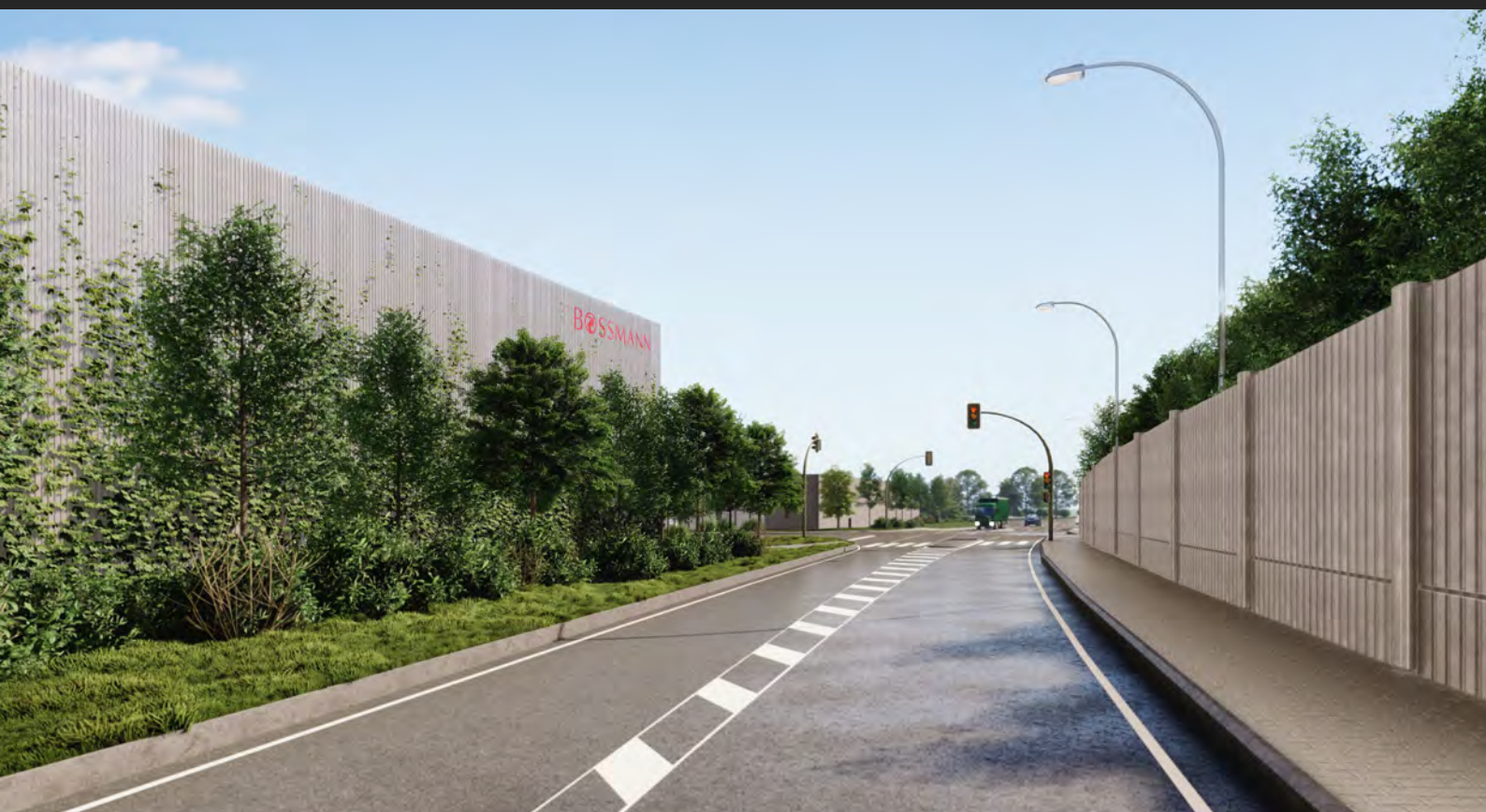
Retailový a logistický areál, Karlovarský kraj, ČR Retail and logistics site, Karlovy Vary region CZ