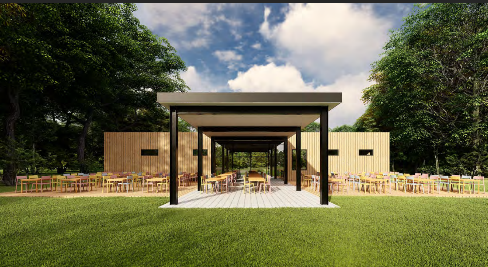
Kavárna se zázemím pro sportovce, Praha, ČR Café with sports facilities, Prague, CZ