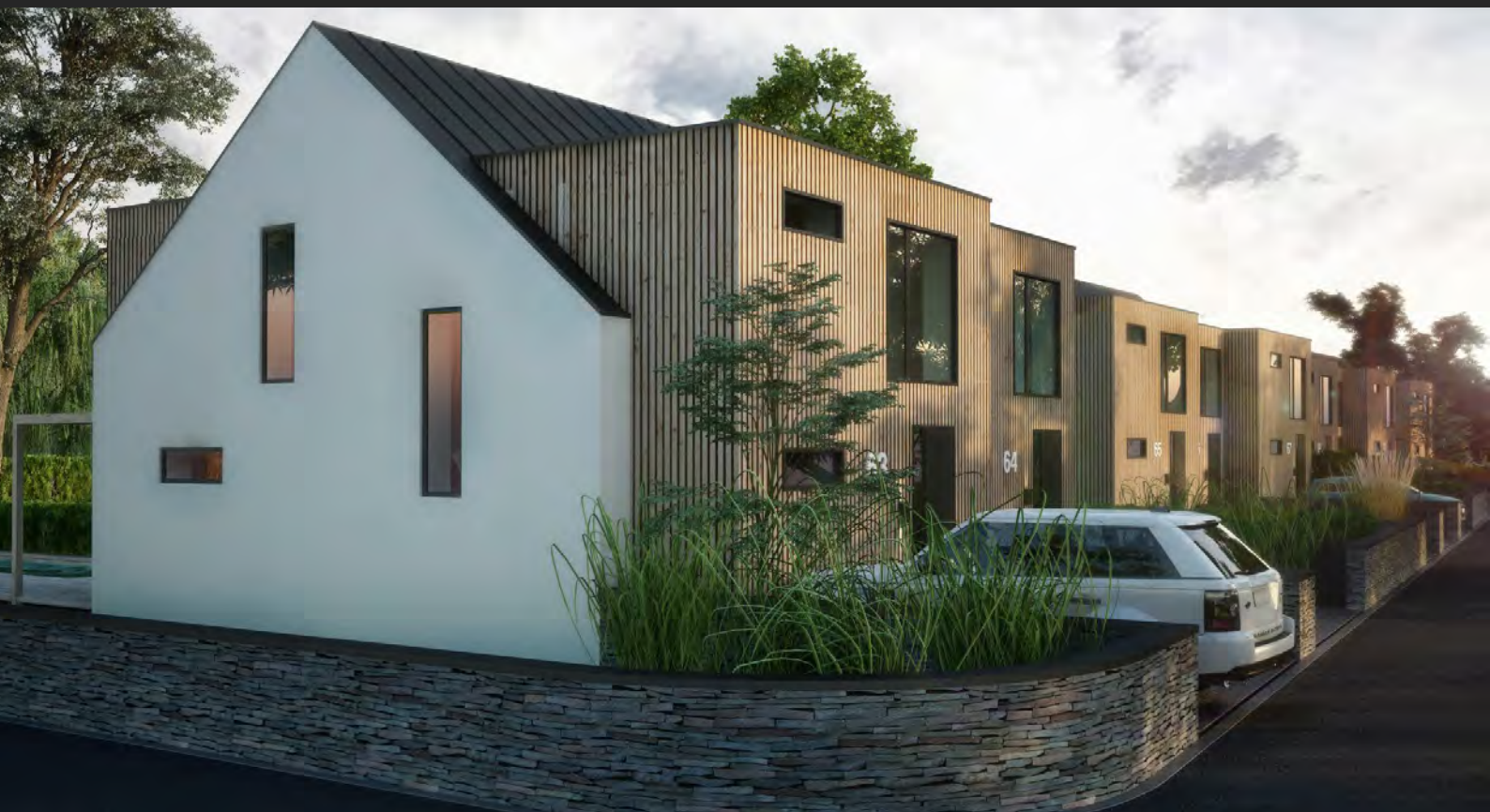
10 Rodinných dvojdomů, Trnavský kraj, SK 10 semi-detached houses, Trnava region, SVK