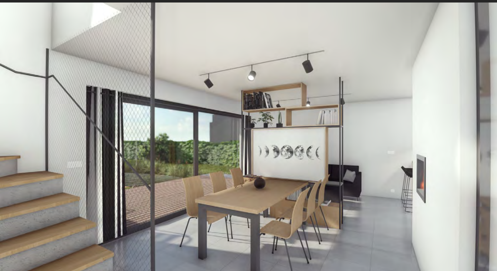
Interiér rodinného domu, Středočeský kraj, ČR Interior of a house, Central Bohemian region, CZ