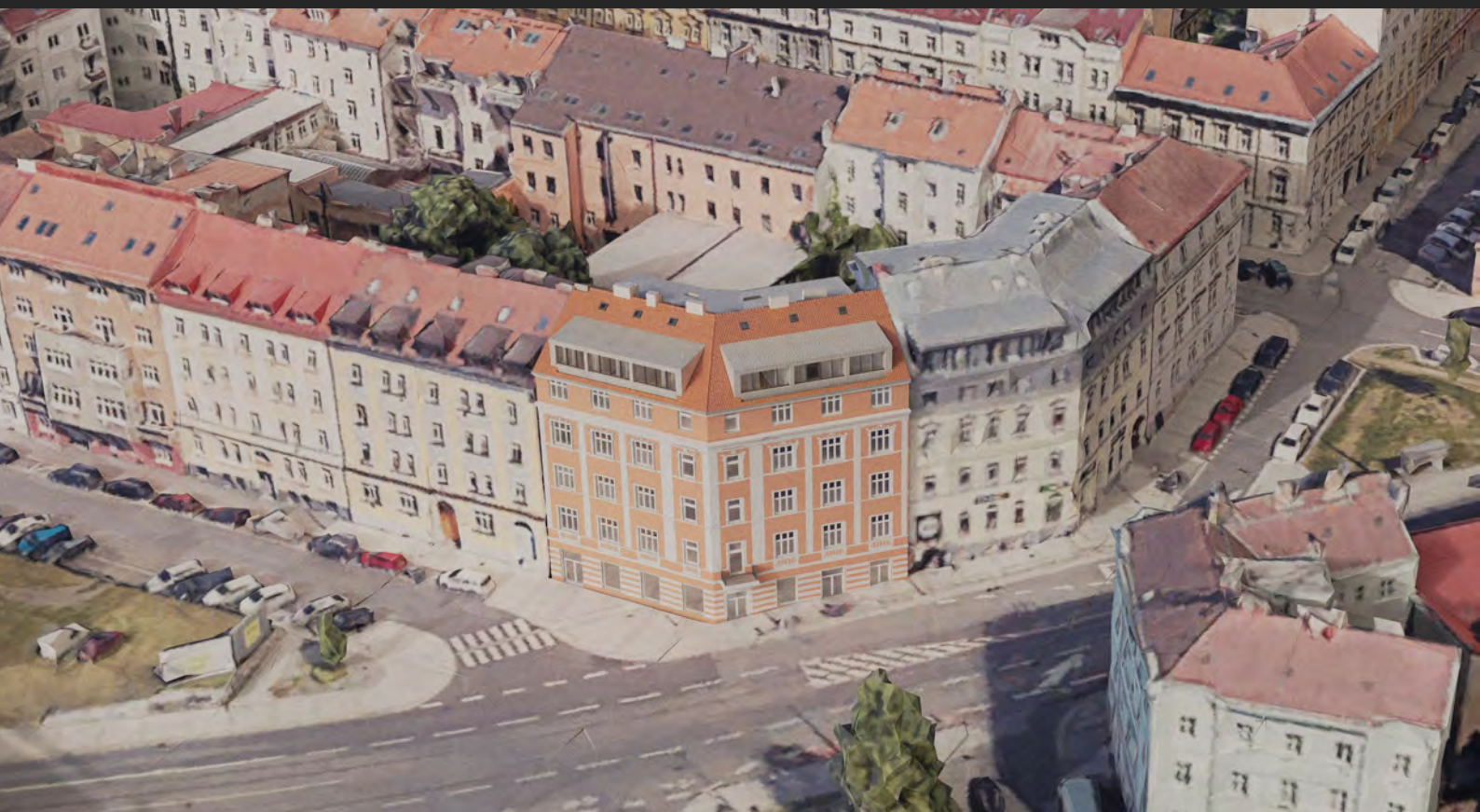
Půdní nástavba 10 bytových jednotek, Praha, ČR Attic extension of 10 residential units, Prague, Czech Republic