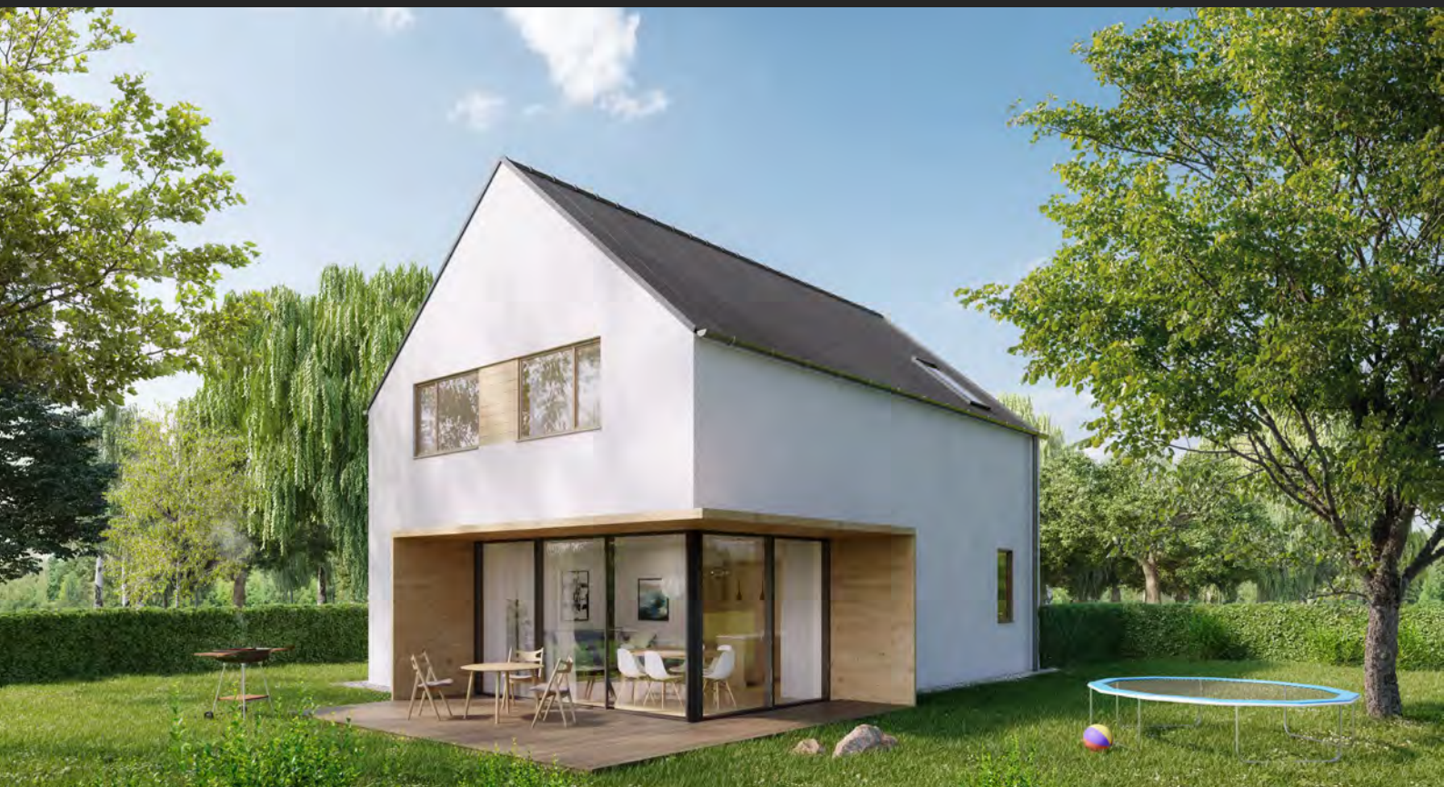
Studie typových rodinných domů, ČR Design of family houses, CZ