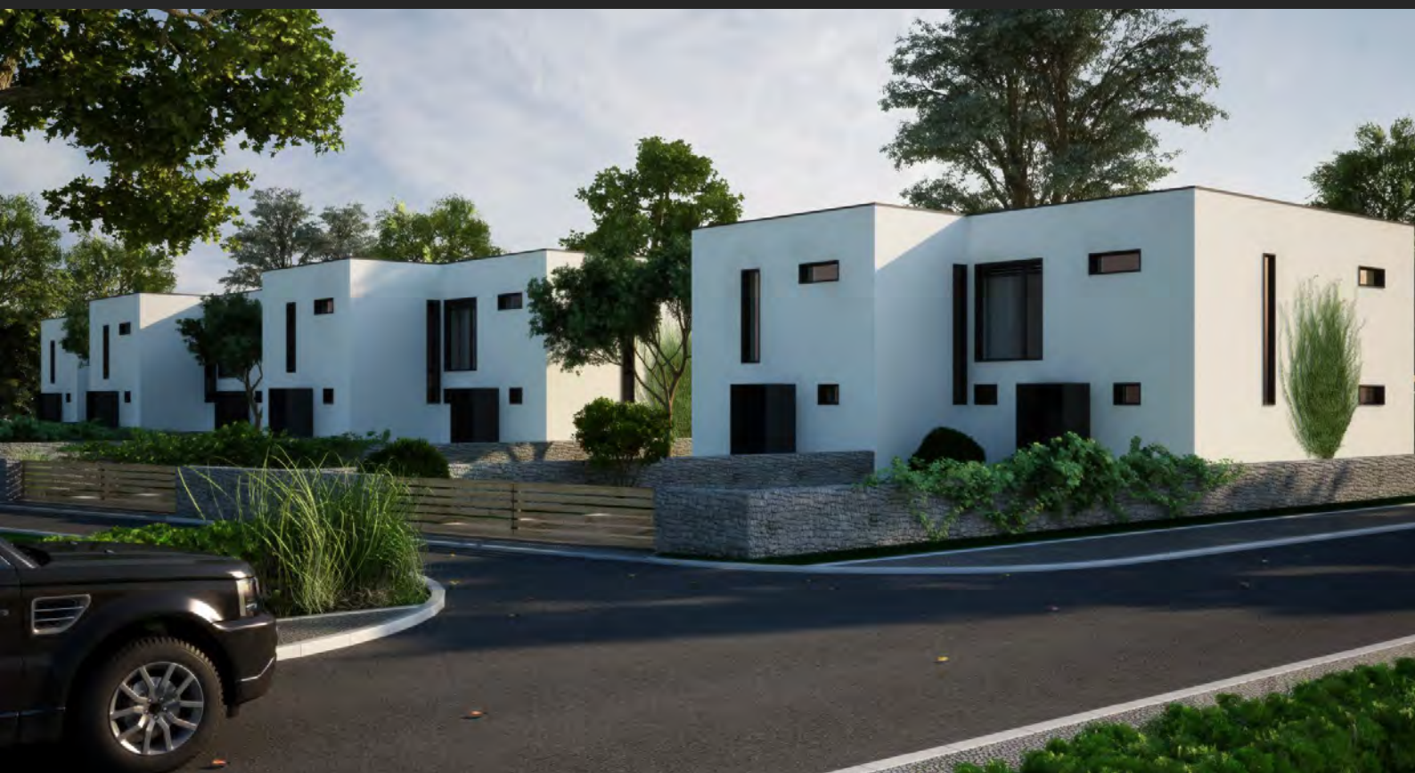
8 rodinných dvojdomů, Středočeský kraj, ČR 8 semi-detached houses, Central Bohemian region, CZ