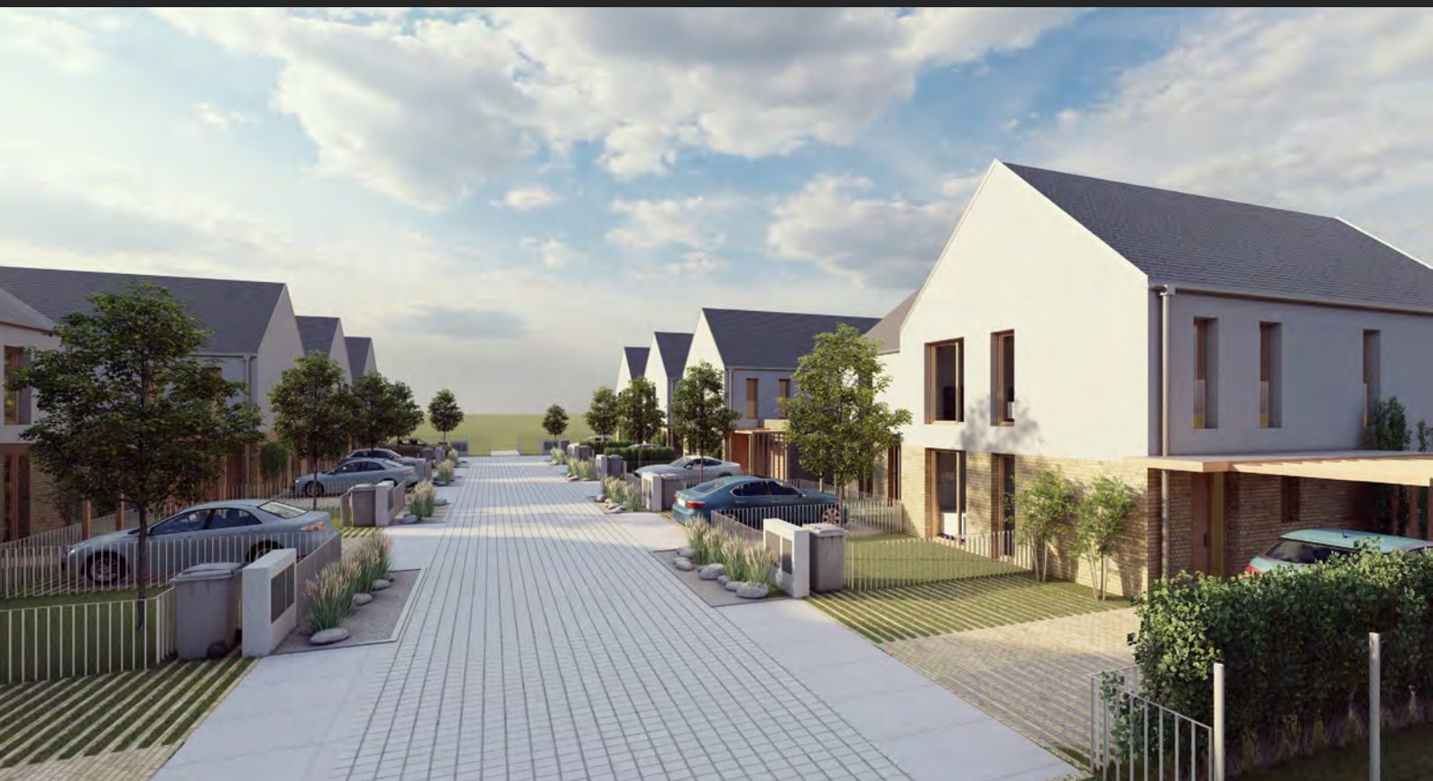
Lokalita 36 rodinných domů, Středočeský kraj, ČR Locality of 36 houses, Central Bohemian region, CZ