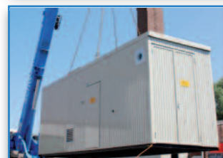
KONTEJNEROVANÉ PARNÍ ZAŘÍZENÍ kompletně vybaveno a připraveno k provozu