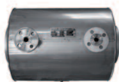
CERTECON Výměník tepla spalin pro Junior 80 - 400

Navíc: zařízení na změkčování vody, dávkovací zařízení