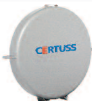
PARCOVAP® Výtěžek rekuperace kondenzačního tepla

Snížení spotřeby množství chladicí vody u parních zařízení se směšovacími chladiči v případě nutnosti chlazení vody do kanalizace