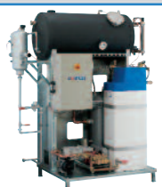
CVE Zásobovací jednotka jako kompletní instalace kotelny připravená k provozu

Navíc: zařízení na změkčování vody, dávkovací zařízení