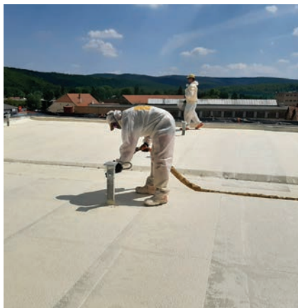
Nástřik detailu rektifikační patky