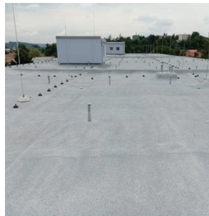
Hotový střešní plášť připravený pro instalaci nosné konstrukce FVE