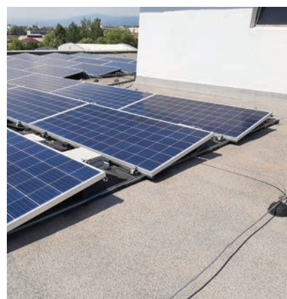
Přetížená konstrukce FVE, pomocí betonových prvků