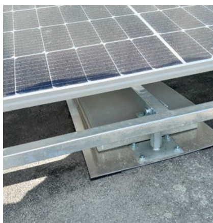
Rozložení zatížení konstrukce pomocí roznášecí desky na povrchu střechy