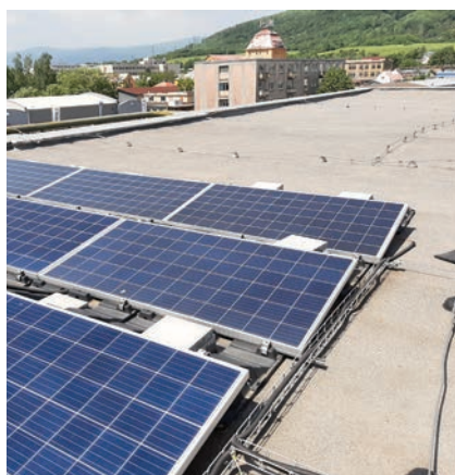
Osazené FV panely s dodatečnou podkonstrukcí