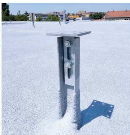
Finální řešení kritického detailu nosné patky