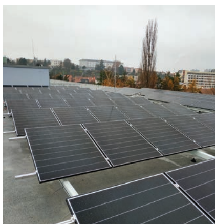
Konstrukce FVE osazená na předem připravených patkách