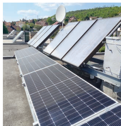
Konstrukce FVE vynesená přes obvodové atiky