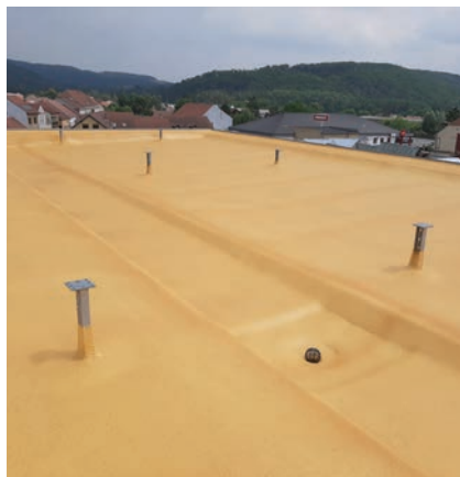
Střecha po nástřiku pěnou PUR