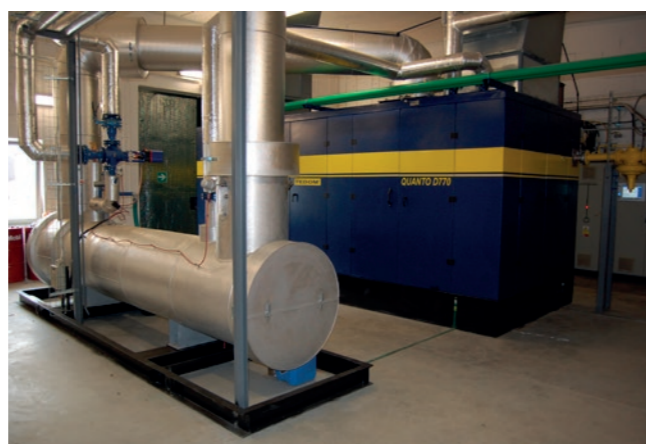
Bioplynová stanice Lesonice (CZ)