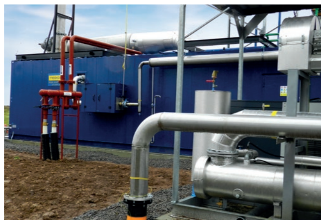
Bioplynová stanice Čabradský Vrbovok (SK)