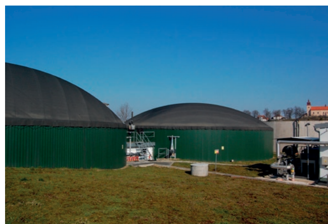
Bioplynová stanice Čáslavice (CZ)