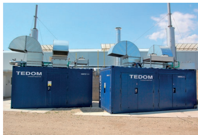
Bioplynová stanice Suchohrdly (CZ)